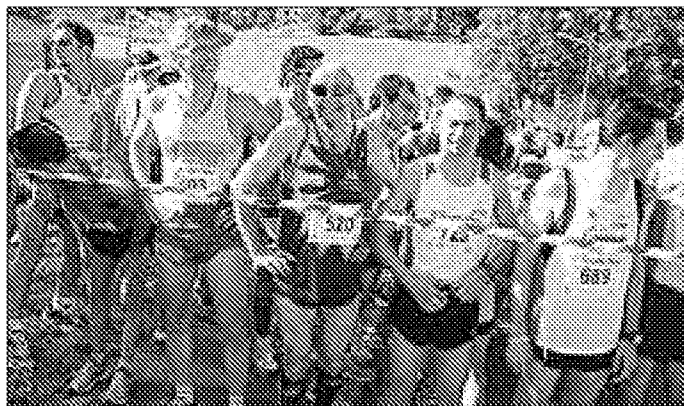
La partenza del Giro della Pietra 2011