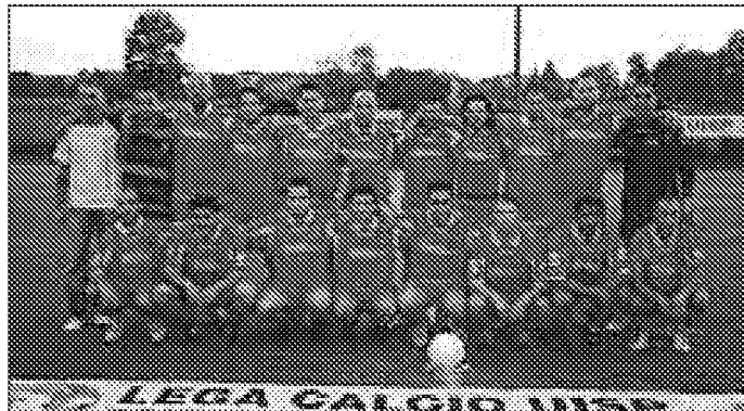
La compagine del Rondò, vincitrice della Coppa di Lega

Alla fine il successo è andato ai ragazzi del Penta Lions, che si sono imposti con il punteggio di 2-1; una buona partita, con una segnalazione speciale per la